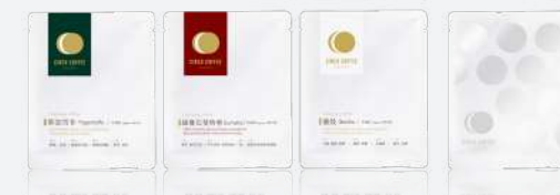
濾掛式咖啡 / 浸泡式咖啡