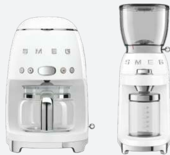
SMEG | 會議型咖啡的秘書幫手。