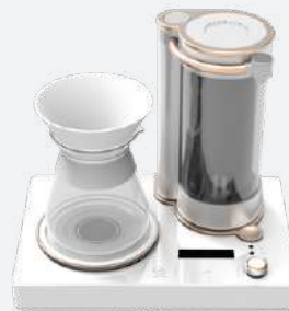
GEESAA | 來沖一杯冠軍咖啡招待您的VIP客戶。